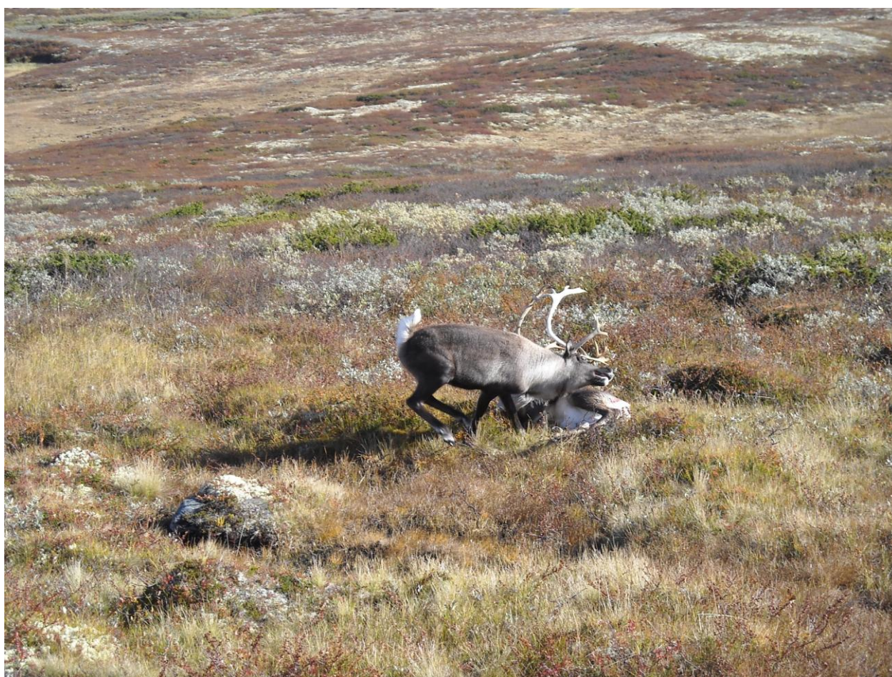
Foto av to bukker som henger sammen etter gevirene. Disse to hadde hengt sammen i nesten 3 uker før den ene ble skutt. Uten inngripen ville de begge fått et trist endelikt.

Også forhold som villreinoppsynet må ta tak i.